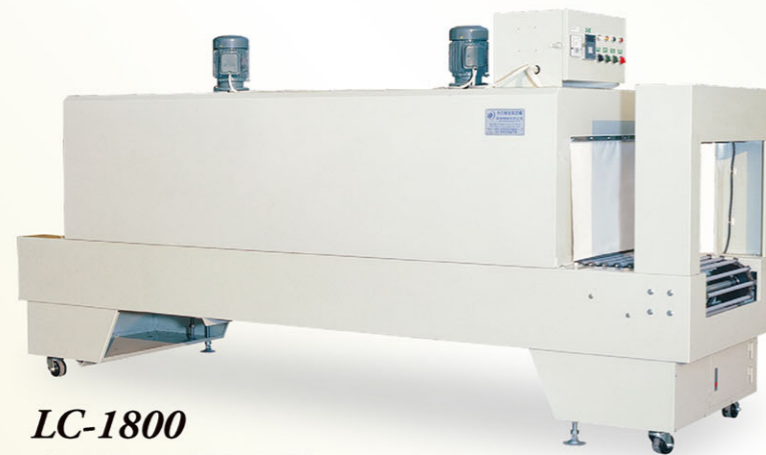
LC-1800 (PVC, POF, PE)