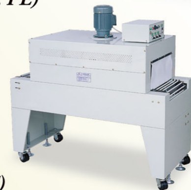
LC-1000 (PVC, POF)