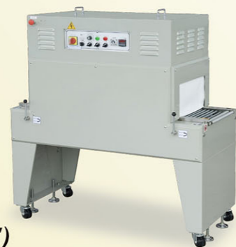
LC-1000E(CE) (PVC, POF)